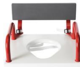
144900, hel sits

Kan tvättas med alkalisk tvällösning, ph 5-9.